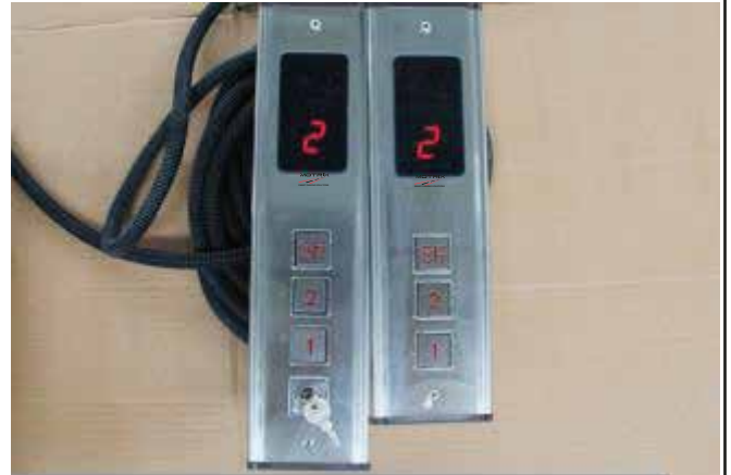
Control de mando con panel digital