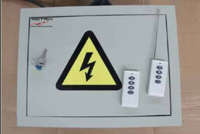
Sistema eléctrico con control remoto