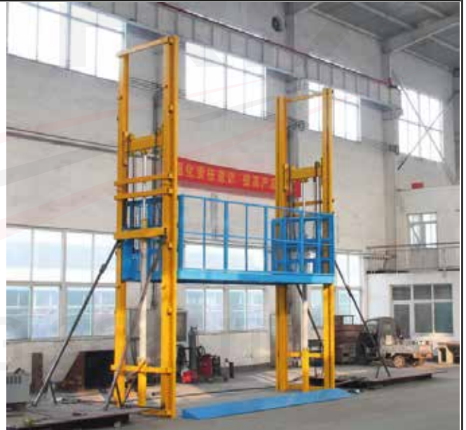
2do Piso / En acción